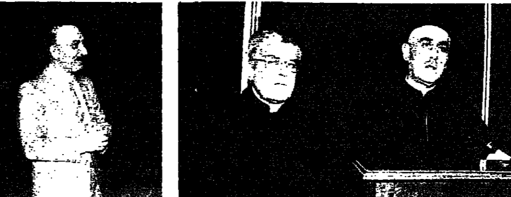
الطهران أبو جوده يصرح وال جنبه الأب نجيم (دائلي وشيرا) الحسيني